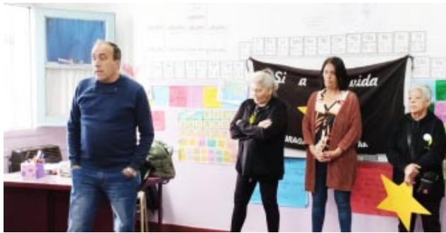
Desde la Dirección General de Seguridad comentario

-La Dirección General de Seguridad del municipio, en conjunto con la organización Estrellas Amarillas, continúa con las charlas de concientización vial en las escuelas