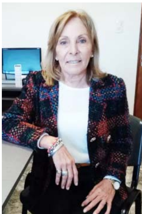
ciones con sistemas de provisión de energías renovables.

Un Proyecto de Ordenanza adhiriendo al «Régimen de Fomento a la generación distribuida de energía renovable integrada a la red eléctrica pública» otorga exenciones y bonificaciones en distintas tasas municipales alcanzando, también, a quienes planifiquen construc-