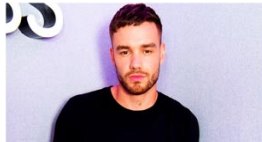
La muerte de un joven debe traducirse en medidas que no los dejen librados al azar.

Los sucesos producidos aun estando lejos, no permiten llegar a conclusiones definitivas.