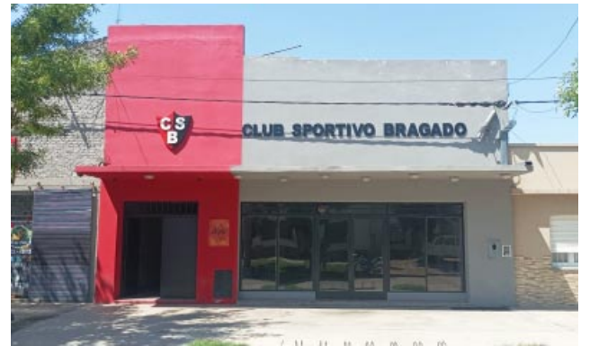
Frente de la sede social del club Sportivo en calle Avellaneda.

En tanto, en el microestadio Daniel "Negro" Torres, se hizo un cableado subterráneo de 50 metros para una mayor seguridad; se repararon todos los vidrios tanto de vestuarios como de baños y se repararon todas las pérdidas de baños quedando estos en óptimas condiciones; se niveló el cam-