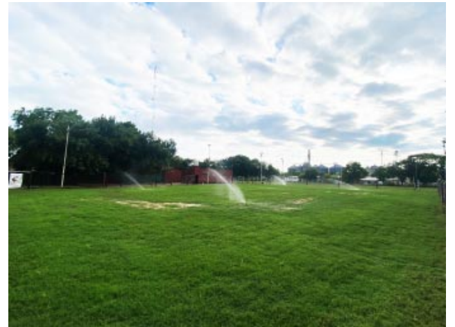
Riego artificial y nuevo césped en el microestadio Daniel "Negro" Torres.

po de juego, se sembró y se repararon todos los riegos y se reparó todo el alambre perimetral agregando más palos olímpicos.