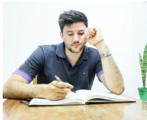
-Por Gonzalo Ciparelli

En lo que a mí respecta, me llaman poderosamente la atención esas conexiones que no esperábamos y nos hacen