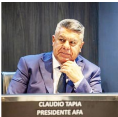
CLAUDIO TAPIA PRESIDENTE AFA

La Cámara Federal de San Martín le dio la razón a la Asociación del Fútbol Argentino (AFA) y ordenó la suspensión de los artículos 335 y 345 del Decreto de Necesidad y Urgencia 70/2023 que habilita las Sociedades Anónimas Deportivas (SAD) que impulsa con fuerza el Gobierno de Javier Milei.