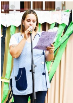
En un clima de emoción y alegría de todas las familias, se compartió un lindo momento con música, bailes y risas. Estuvo presente la direc-

-Con gran entusiasmo, se celebró este jueves el cierre de año en el Espacio de Primera Infancia (EPI) "Pimpollitos"